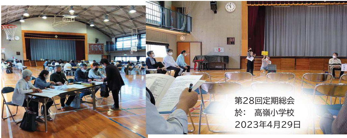
第28回定期総会 於：高嶺小学校 2023年4月29日